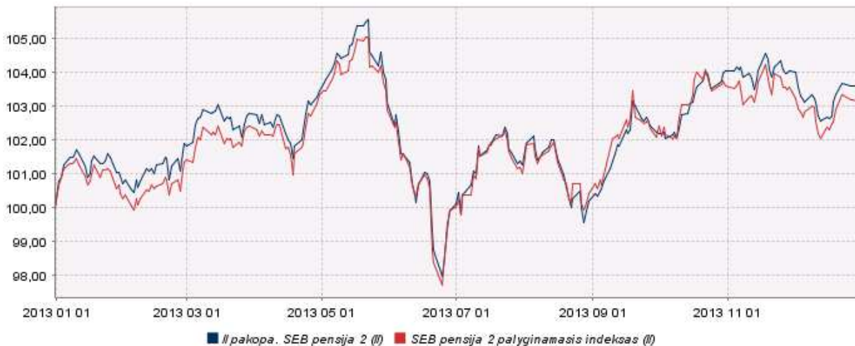
Fondo pelningumo/kainos ir palyginamojo indekso dinamika