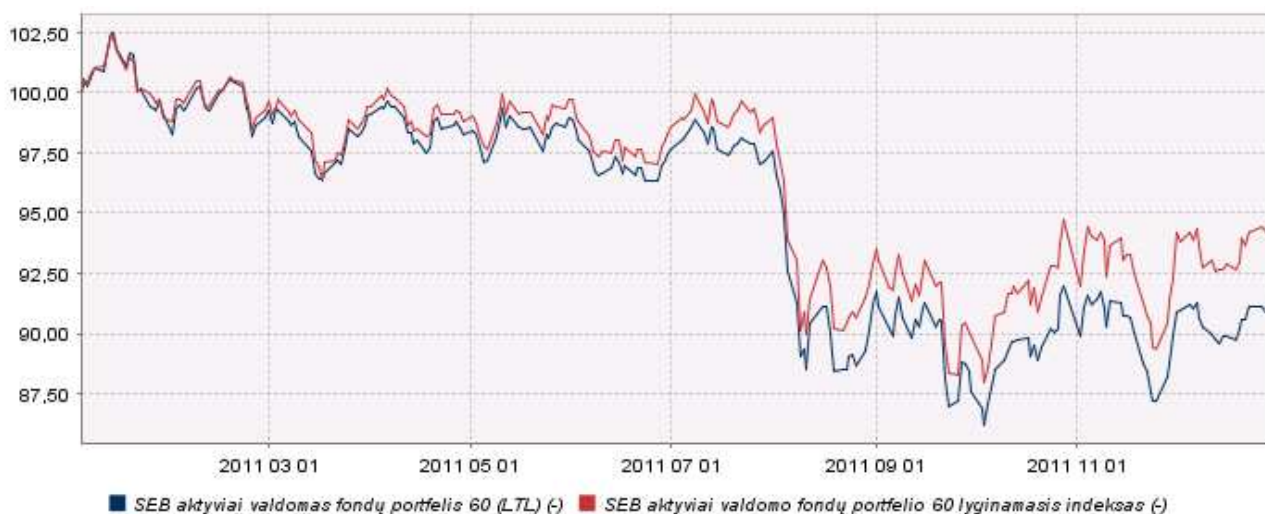
Fondo pelningumo/kainos ir palyginamojo indekso dinamika